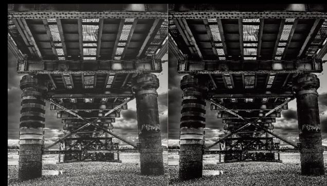
普通啞光黑色墨水